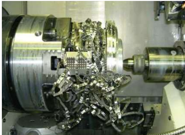
Werkzeugverschleiß mit HD-KSS-Zufuhr