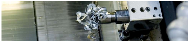
Ohne Hochdruck Without high pressure