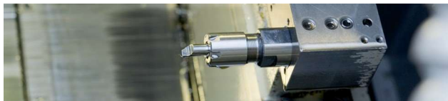
Mit Hochdruck With high pressure